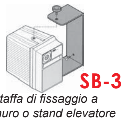
Staffa di fissaggio a muro o stand elevatore

CXXFM-20 Cavo per microfono XLR 3 poli M/F da 20 m.